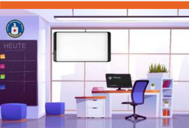
Beispiel für einen Meetingraum. Hier kann bspw. ein Video abgespielt werden.