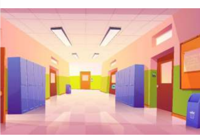
Beispiel für einen Themenflur mit abgehenden Schulungsräumen